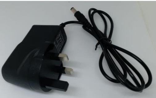
英規電源器 長度: 1m