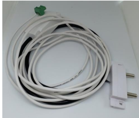
漏水傳感器 長度: 2m