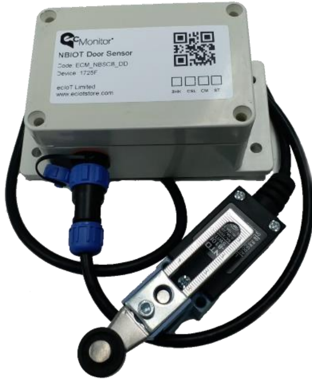
NBIOT主機 尺寸: 100(L) x 70(W) x 50mm(H)