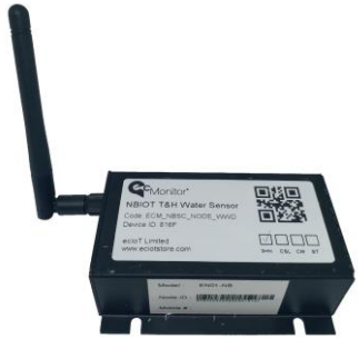
NBIOT主機 尺寸: 90(L) x 50(W) x 30mm(H)